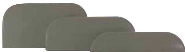
XL Standard S