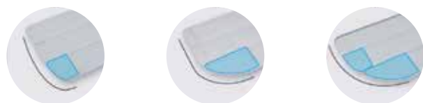
Rayon de 5 cm Rayon de 10 cm Rayon de 15 cm